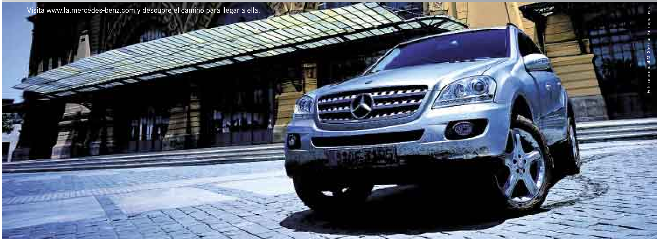
Foto referencial M1350 con Kit deportivo.

Visita www.la.mercedes-benz.com y descubre el camino para llegar a ella.