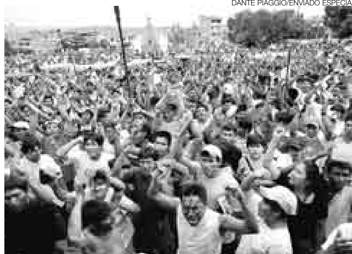
ALGARABÍA. Esta vez los pobladores no salieron a las calles a protestar sino a expresar su alegría por la derogatoria de los decretos 1015 y 1073.

De inmediato, la plaza principal se llenó de gente: nativos, pobladores de Bagua y curiosos celebraron