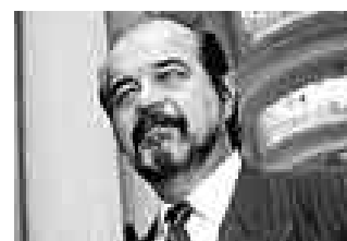
MAURICIO MULDER PARTIDO APRISTA

“ Hay quienes defienden el statu quo de las comunidades empobrecidas. Estos decretos son un cambio revolucionario para sacarlos de la pobreza, pero hay quienes defienden posiciones anacrónicas”.