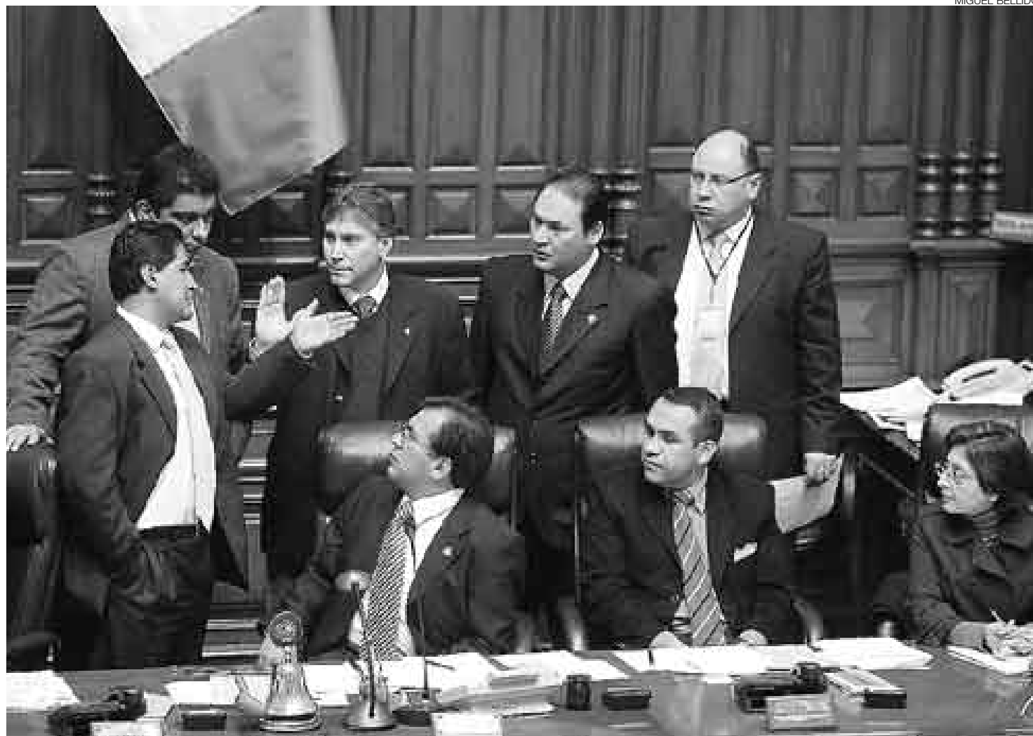
AGITACIÓN. El Congreso vivió una jornada de mucho debate. Los representantes de las diferentes bancadas mostraron todas sus cartas.

Los fujimoristas y los de UN consideraban que la intención