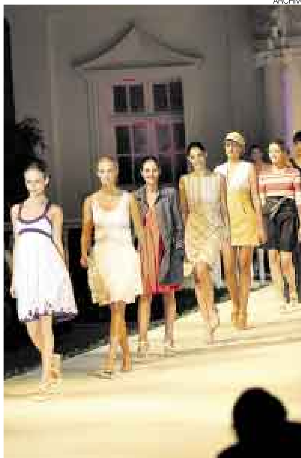
PASARELA. Como cada año, habrá desfiles de modas.

También habrá espectáculos gratuitos dentro de El Rastrillo: el tenor Fernando Alcalde con Cuerdas de Lima, grupo