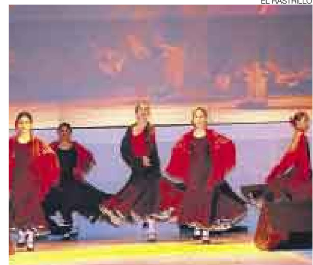
OLÉ. La danza flamenca se lucirá en el escenario.