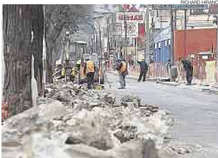
CAMBIOS. El concejo limeño asegura que los trabajos durarán dos meses.

En nota de prensa, el Concejo de Lima informó que el plan de desvío consideraba que los buses y autos abandonarían la Av. Arequipa en la cuadra 21 para tomar la Tomás Guido y luego siguieran por la Av.