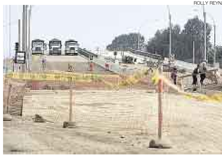
AVANCE. Las obras entre Venezuela y Universitaria tienen un avance de 80%.