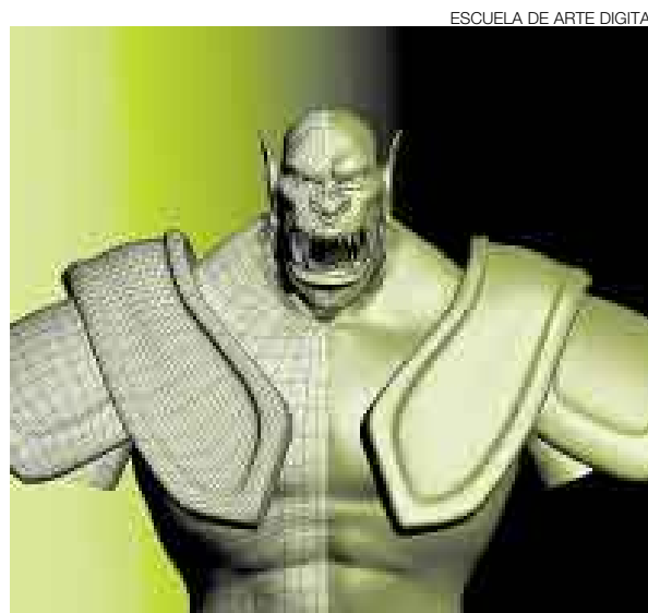
ESCUELA DE ARTE DIGITAL