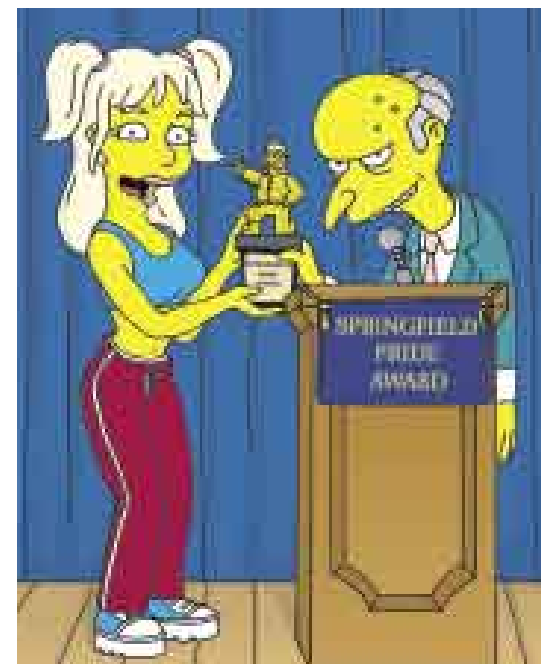
VISITA. Britney Spears se encargará de entregar el premio Orgullo de Springfield al señor Burns.