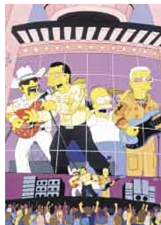
CANDIDATO. En su búsqueda por conseguir un lugar como político, Homero cantará con el grupo irlandés U2.

Lisa en su búsqueda por conseguir la armonía con su alrededor se encontrará con Paul y Linda McCartney.