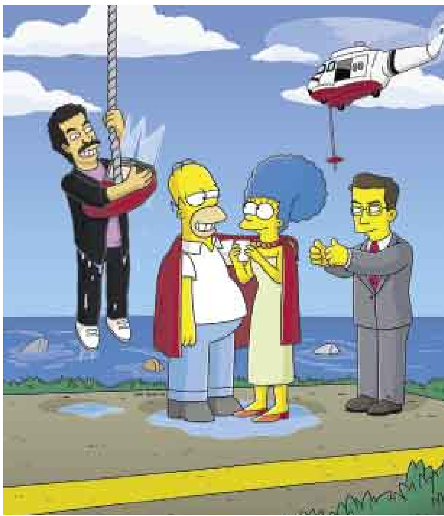
VOLVER A EMPEZAR. Un viaje en avión privado con Lionel Richie le cambiará a Homero.

El jueves Britney Spears llegará a la mansión del gruñón señor Burns y en el siguiente episodio Marge, quien se convierte en una adicta a los juegos en Internet, se encontrará con el brasileño Ronaldo. Para finalizar, el viernes Kieffer Sutherland aparecerá cuando el profesor Skinner inaugura una unidad especial para controlar las faltas en el colegio. Además, Homero se encontrará con Lionel Richie. ●