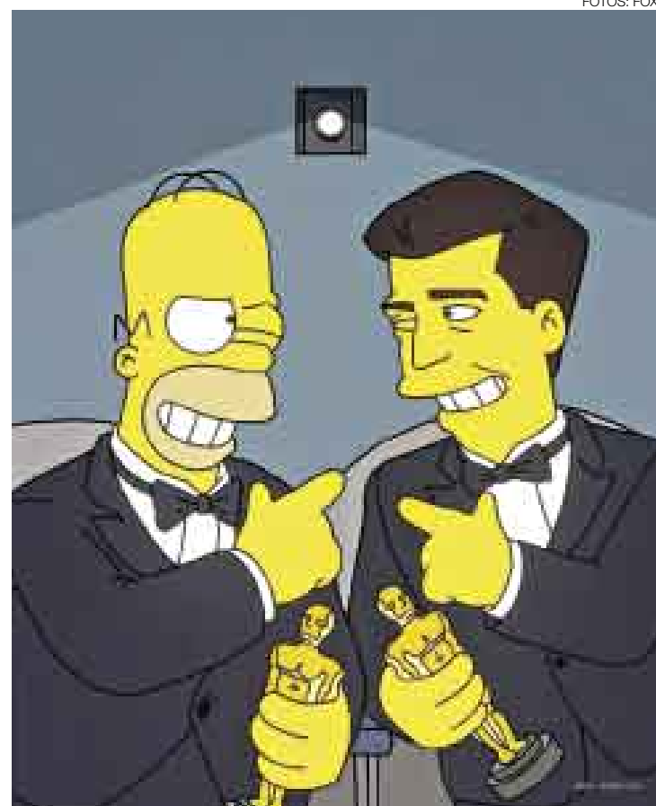
GOLPE DE SUERTE. Para sorpresa de todos, Homero será convocado por el actor estadounidense Mel Gibson para que edite su última película.

Con motivo de su aniversario 15, la cadena Fox presentará a partir de mañana a las 9 p.m. un recuento de los capítulos especiales de la serie “Los Simpson”, en los que la familia amarilla se encontró con famosos personajes del espectáculo.