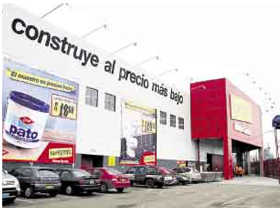
MAESTRO. ES EL MÁS RECIENTE PROTAGONISTA DEL 'RETAIL' EN LIMA NORTE.

Además, el crecimiento del poder adquisitivo en esta zona ha sido importante: en las últimas encuestas del INEI, Lima norte suele salir como la zona de la capital que más ha crecido en ingresos. Y si a ello sumamos que el 54% de los visitantes del Megaplaza proviene de la misma Lima norte (un indicador de que la gente de allí prefiere no moverse de su zona), encontramos una combinación bastante interesante: mucha gente, con preferencia por quedarse cerca a su distrito, y con mayores y crecientes ingresos. “La venta por metro cuadrado del Tottus del Megaplaza es la mayor de Lima”, señala la Rey de Castro. Por ello,