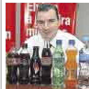
EN BOTELLA. LA NUEVA PRESENTACIÓN COSTARÁ S/.5.

La filial local de The Coca-Cola Co. lanzó esta semana al mercado la nueva presentación de su bebida energizante Burn. Ahora se podrá adquirir en botella de vidrio de 250 ml a S/.5 en supermercados, grifos y bodegas.