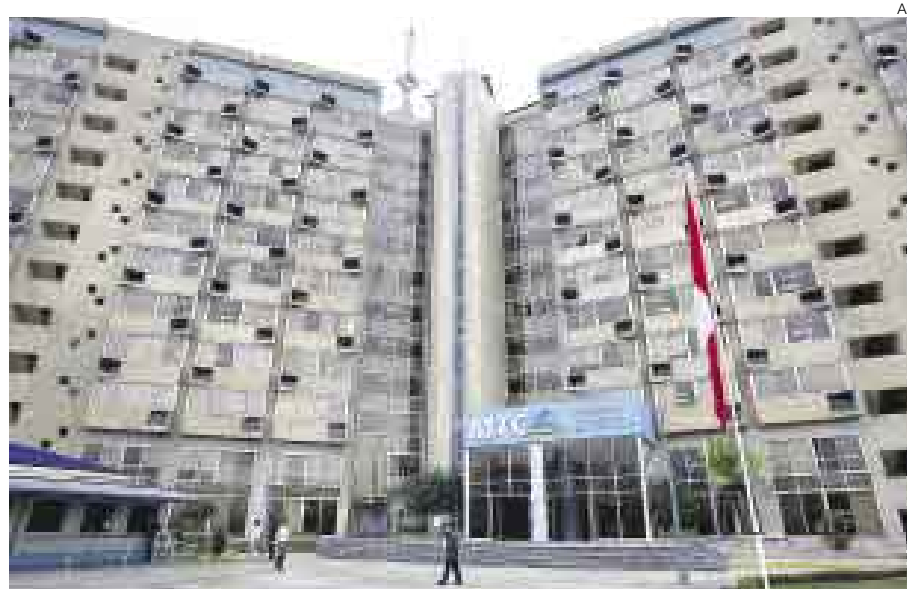
¿MALA RELACIÓN? EL REGULADOR Y EL MINISTERIO SE PELEAN POR LA PORTABILIDAD NUMÉRICA.