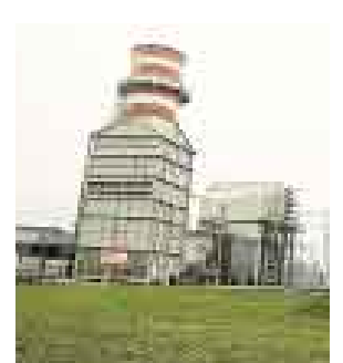
PRIMER PEDIDO. ELECTRO-PERÚ SOLICITÓ COTIZACIÓN.