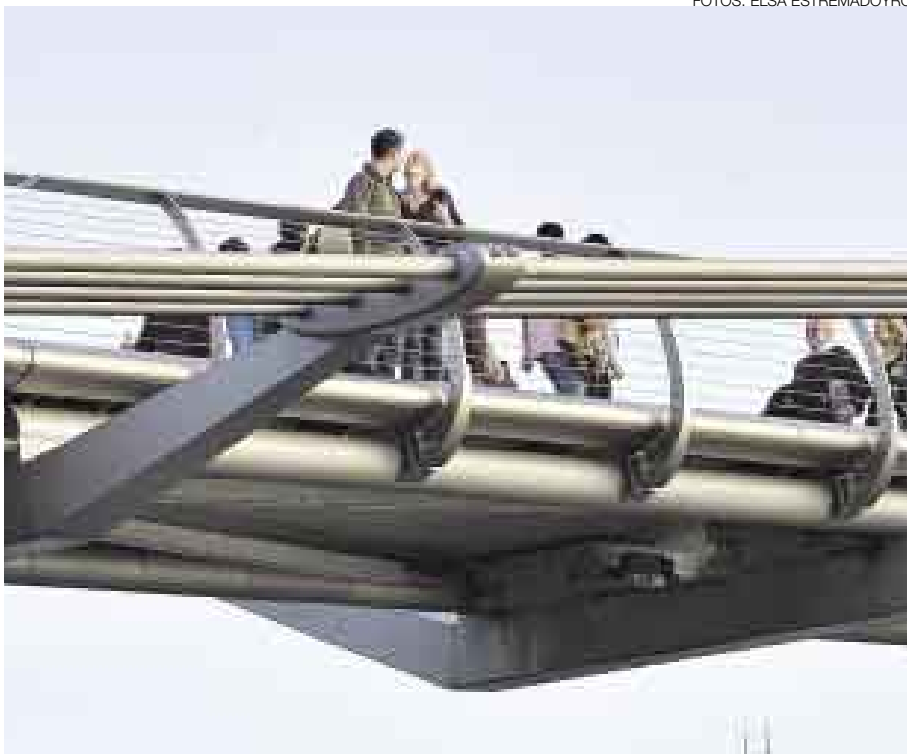
JOYA. El Puente del Milenio fue creado por el famoso arquitecto Norman Foster.