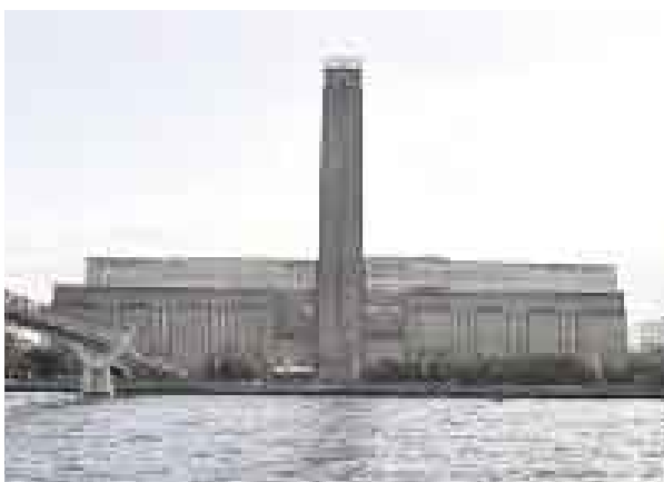
TATE MALL. Este museo antes era una central eléctrica.