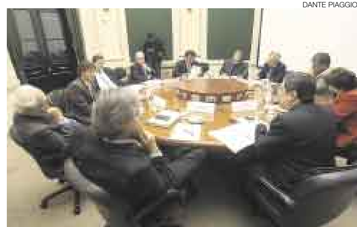
MESA REDONDA. Lectora pide debate sobre los transgénicos. Aquí se lo damos con presencia de ministros y expertos (ver: Pelea transgénica).