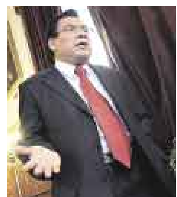
CAMBIOS. Velásquez dice que impulsará reformas constitucionales.

“La renovación por tercios plantea ir cambiando a los congre-