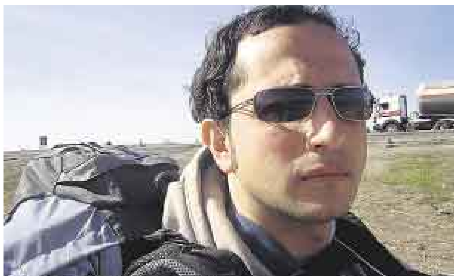
VIAJERO. Desde los 19 años recorre el mundo en búsqueda de historias, personas y destinos.

Tal vez sí les parecía extraño, porque en el caso de ellos nunca habían dejado el país, algo completamente diferente a lo que su hijo deseaba.