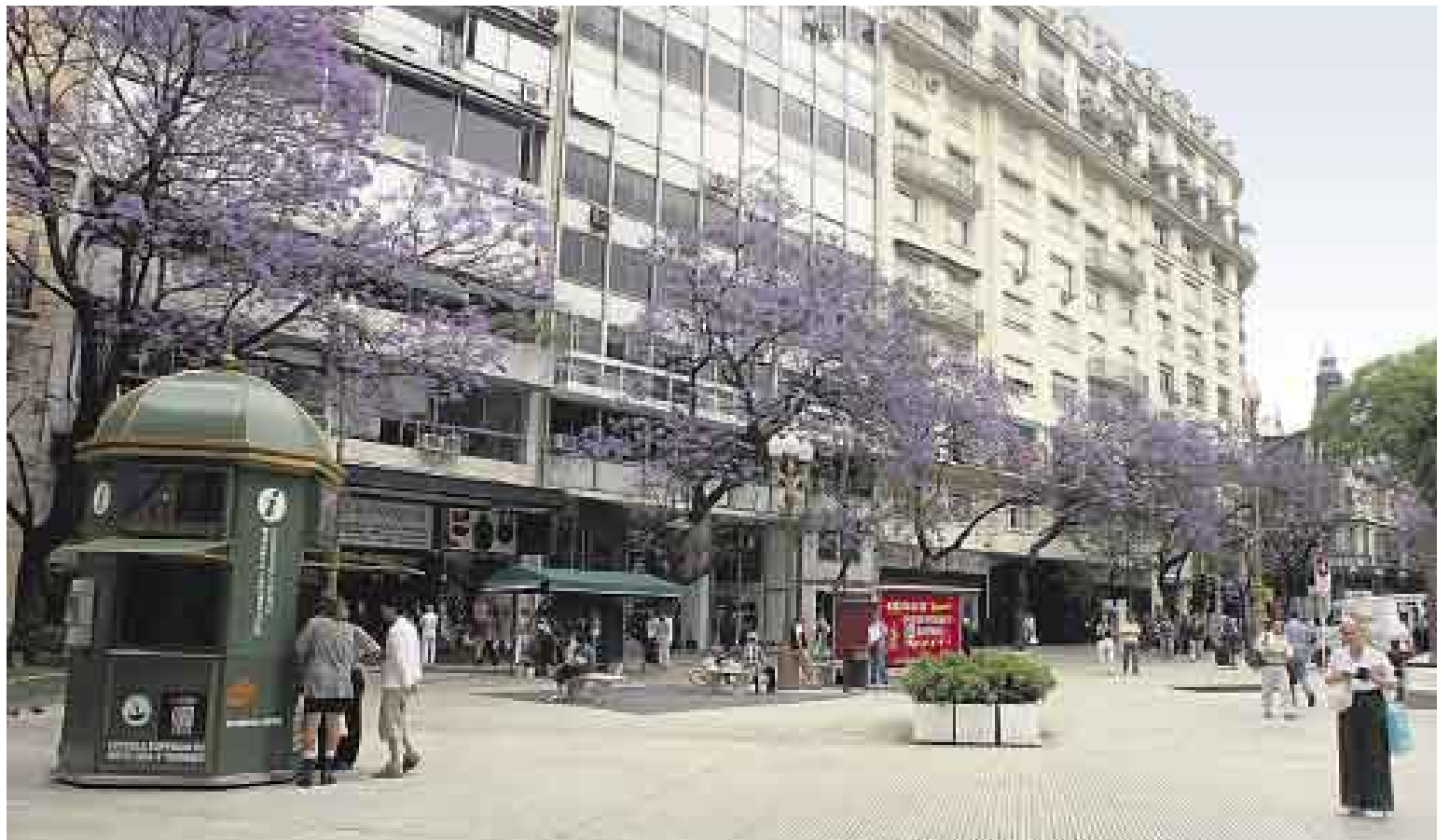
SU SEGUNDO HOGAR. Buenos Aires se ha convertido en un rincón al que siempre vuelve.