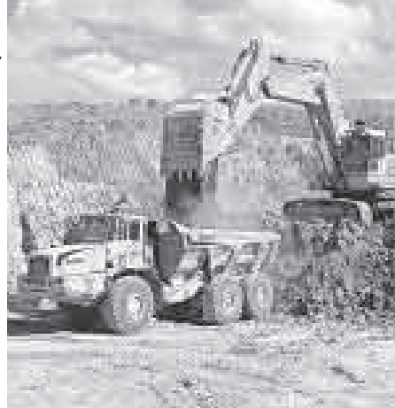
El proyecto Ravensthorpe, en Australia, aún no es rentable.

drá la producción durante al menos cuatro meses de un proyecto de níquel en República Dominicana debido a que no es tan rentable bajo los precios actuales del níquel. En julio, Xstrata y la canadiense Teck Cominco Ltd. decidieron cerrar una mina de zinc y plomo que operaban en conjunto en Australia. La razón fue la misma: el proyecto no tenía sentido a los precios actuales.