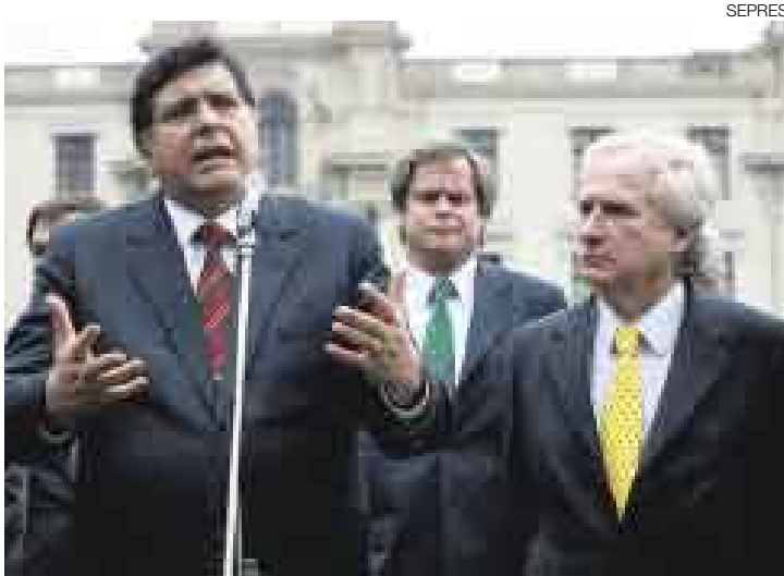
VISITA OFICIAL. Tras una hora de reunión, los parlamentarios chilenos y el presidente Alan García salieron al Patio de Honor de Palacio.

“(La demanda) es un hecho, no la podemos ignorar. Pero eso no puede detener, no puede suspender, no puede posponer