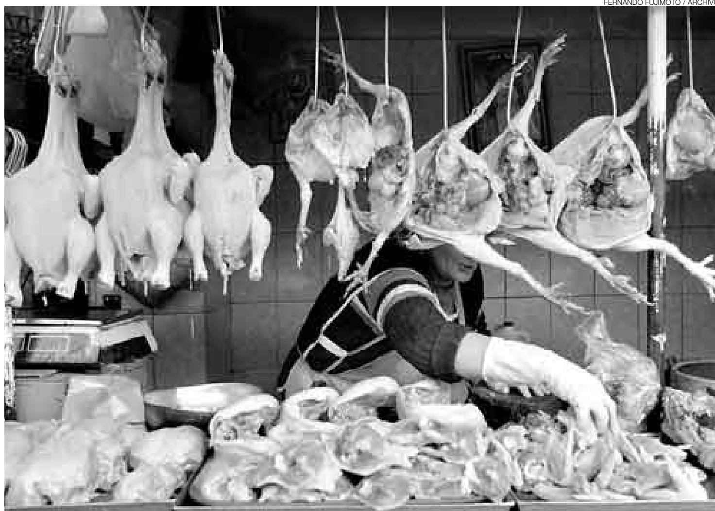
EL MÁS REQUERIDO. El pollo es el producto preferido entre las carnes en el Perú, destaca el Ministerio de Agricultura.