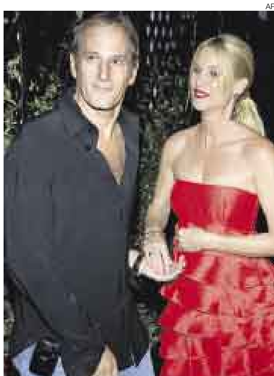
SE TERMINÓ. Nicolette Sheridan y Michael Bolton rompieron su noviazgo.