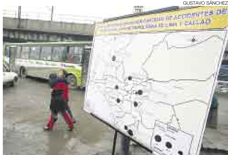
CAUIDADO. En el cruce de las avenidas San Juan y Los Héroes (San Juan de Miraflores) se presentó el mapa de 'puntos negros' de accidentes de tránsito.