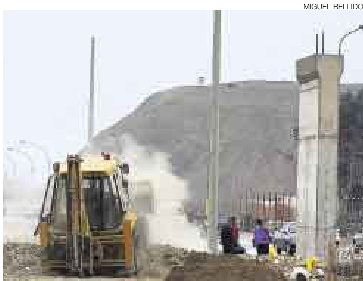
SUSPENDIDOS. Los trabajos en la avenida Venezuela se reanudarán si el Concejo de Lima presenta el proyecto de evaluación arqueológica.