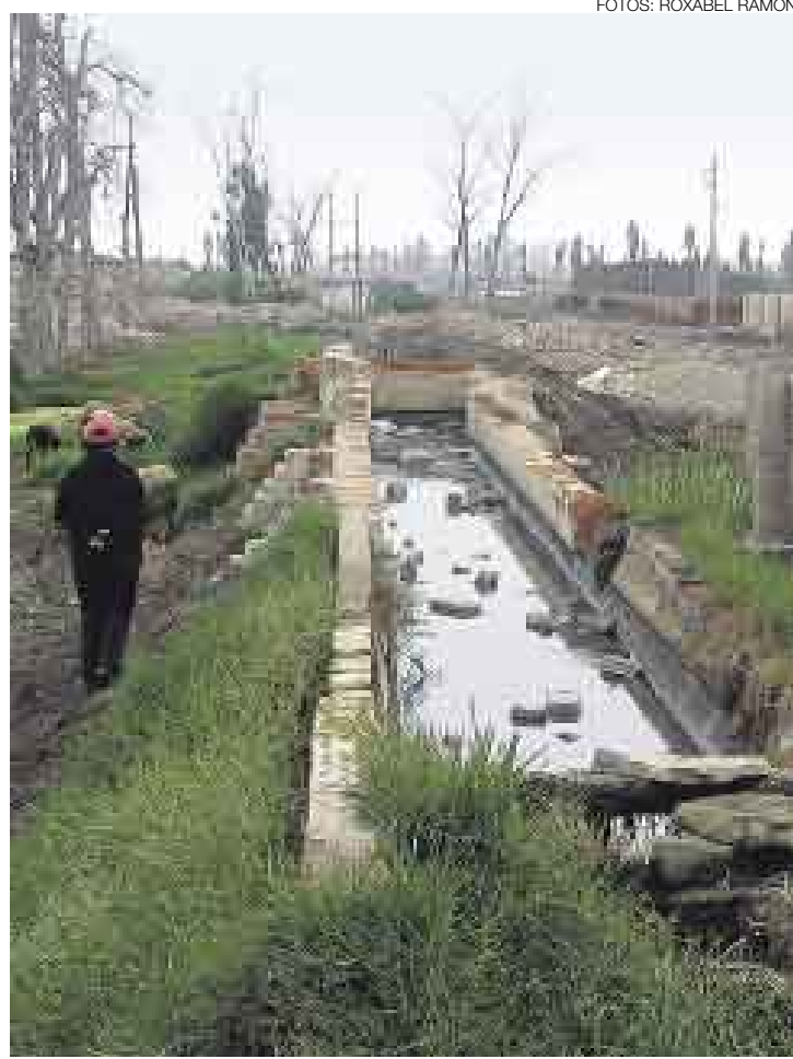
ANTIGUO CANAL. Antes de que las familias se asentaran en Los Huertos de Villa, esta era una zona de pantanos y haciendas agrícolas.

El Comercio comprobó que al menos 80 casas se encuentran en el área más crítica, pues algunas paredes se han desplomado por la humedad y la mayoría de viviendas