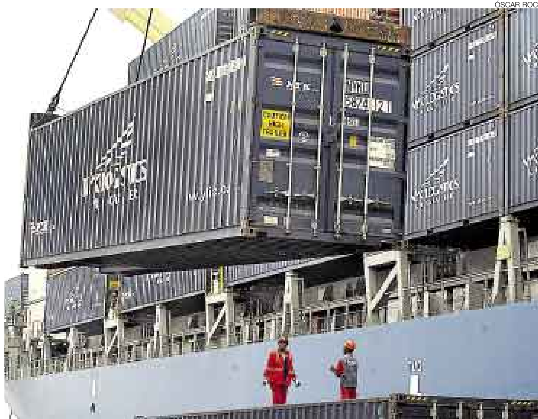
COMERCIO. La expectativa del Gobierno Peruano es lograr más mercados para los exportadores locales.

Este ajuste ha ocasionado un roce entre el Mincetur y la Asociación de Exportadores (ÁDEX), la Sociedad Nacional de Industrias (SNI) y la Cámara de Comercio de Lima (CCL). Hasta ayer no había consenso al respecto. Los gre-