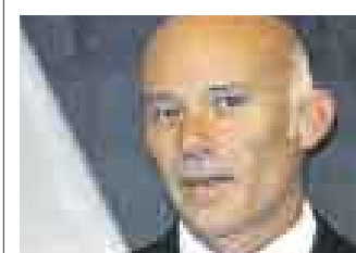
EDUARDO FERREYROS VICEMINISTRO COMERCIO EXTERIOR

► Algunos gremios empresariales expresan su malestar por el nuevo rumbo de las negociaciones con China.