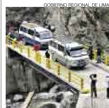
INVERSIÓN. El costo total de la obra fue de S/427.000.