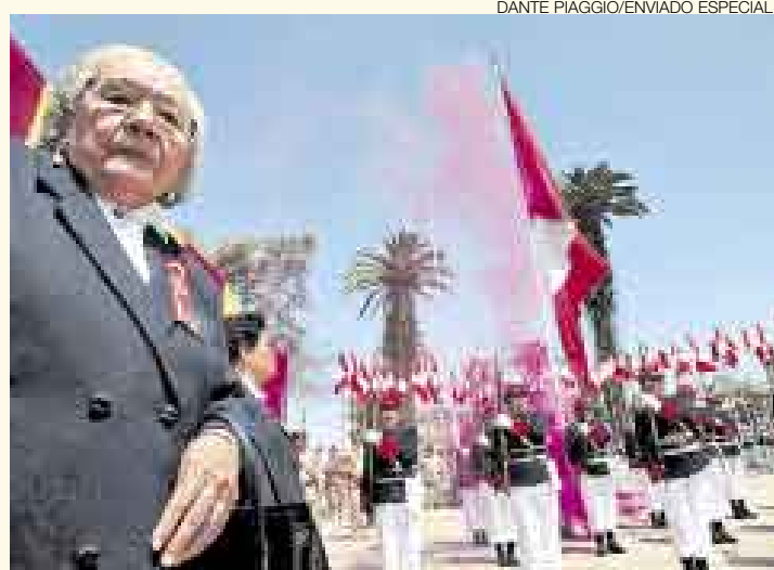
HOMENAJE. La mujer tacneña recibió, como cada año, un merecido reconocimiento. Ellas son el alma de esta heroica región del sur peruano.

Esta ceremonia fue una de las tantas que se organizaron para esta importante celebración. Una fecha en la que no faltó la procesión multitudi-