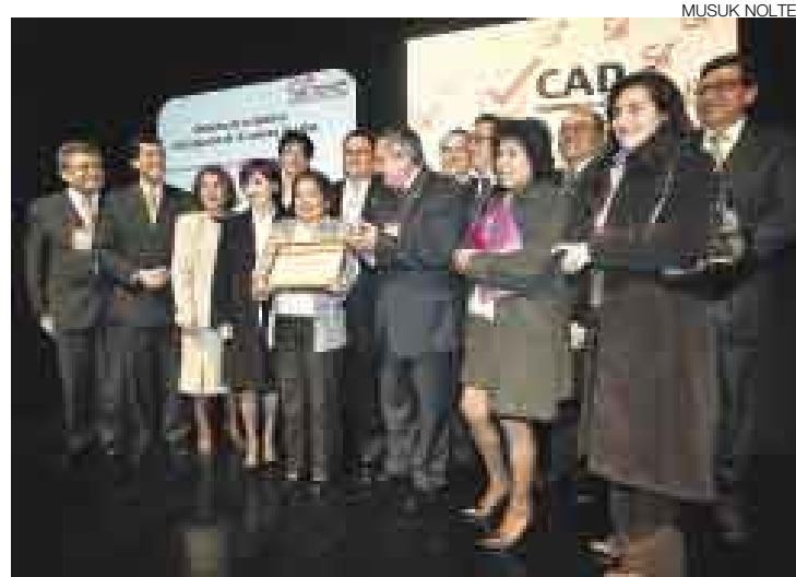
MERECIDO. El presidente del Poder Judicial, Francisco Távara, con los 16 jueces que recibieron la distinción especial, en reconocimiento a su labor.

El detalle de la entrega de los premios a las mejores instituciones públicas lo daremos mañana.