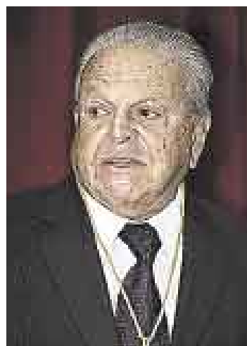
OSTERLING. Echa de menos el sistema bicameral en el país.

“Esta proposición no tiene ni pies ni cabeza y, al tratarse de una reforma constitucional, evidentemente no va a alcanzar los 80 vo-