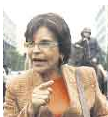
APUNTA. Cabanillas dice que hay “contrabando ideológico” en libros.

aprista se resaltan en el texto el populismo desbocado, la estatización de la banca, las intervenciones en los penales y la creación del comando Rodrigo Franco.