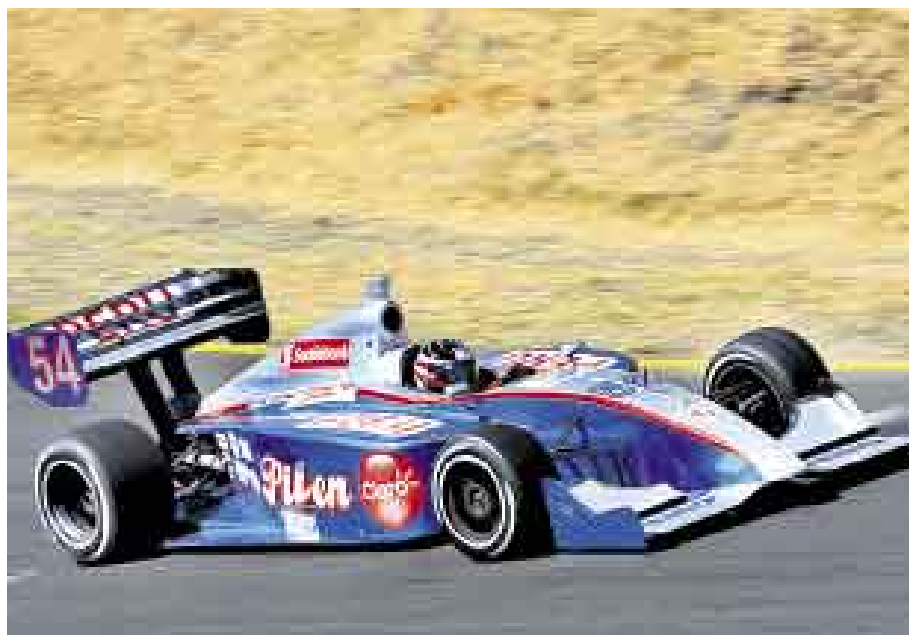
NUEVO EQUIPO. Polar consiguió sitio en el 'team' Guthrie Racing y augura un buen 2009.

cuatro autos destinados y tuvo que alquilar otro a un tercero y prepararlo para que yo lo usara.