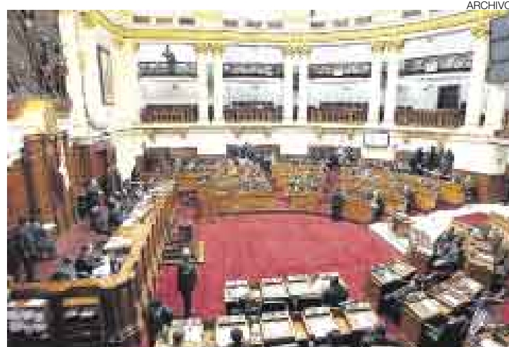
DIFÍCIL TAREA. Los parlamentarios tienen entre sus manos el reto de revertir la mala imagen que tienen entre la población.

Según el vocero de Alianza Parlamentaria (AP), Yonhy Lescano, “toda consulta popular es absolutamente lícita; pero que esta se realice a causa de unos cuantos congresistas que han incurrido en conductas delictivas no se justifica, y tampoco ayudará a me-