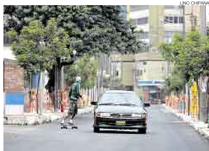
LUZ VERDE. Desde la tarde del último sábado los vehículos han vuelto a circular por las primeras cinco cuadras de la calle Berlín, en Miraflores.

En un recorrido por la zona, este Diario comprobó que hay tramos de las veredas casi intrasitables en el área asfaltada, ya sea porque no están pavimentadas o porque grandes trozos de concreto o la-