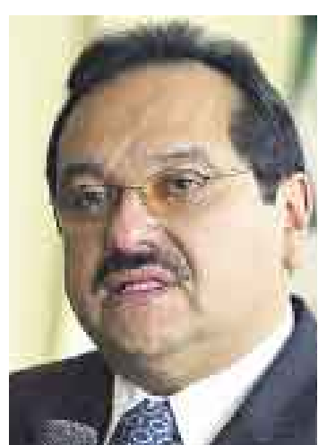
PIDE UNIÓN. Presidente ejecutivo de Devida, Rómulo Pizarro.

El presidente ejecutivo del Consejo Nacional para el Desarrollo y Vida sin Drogas (Devida), Rómulo Pizarro, dijo que el Perú promoverá un frente andino contra el narcotráfico que unifique criterios en la lucha contra esta actividad delictiva. Para este fin —añotó— se encuentra en conversaciones con autoridades de Ecuador y Colombia. “El narcotráfico no tiene fronteras y posee amplios recursos. Hay que hacer que nuestras acciones sean similares”, aseveró a DPA.