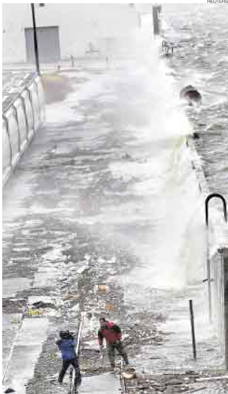
RIESGO. Los periodistas enfrentaron la fuerza de los vientos para cubrir las incidencias del paso del huracán.