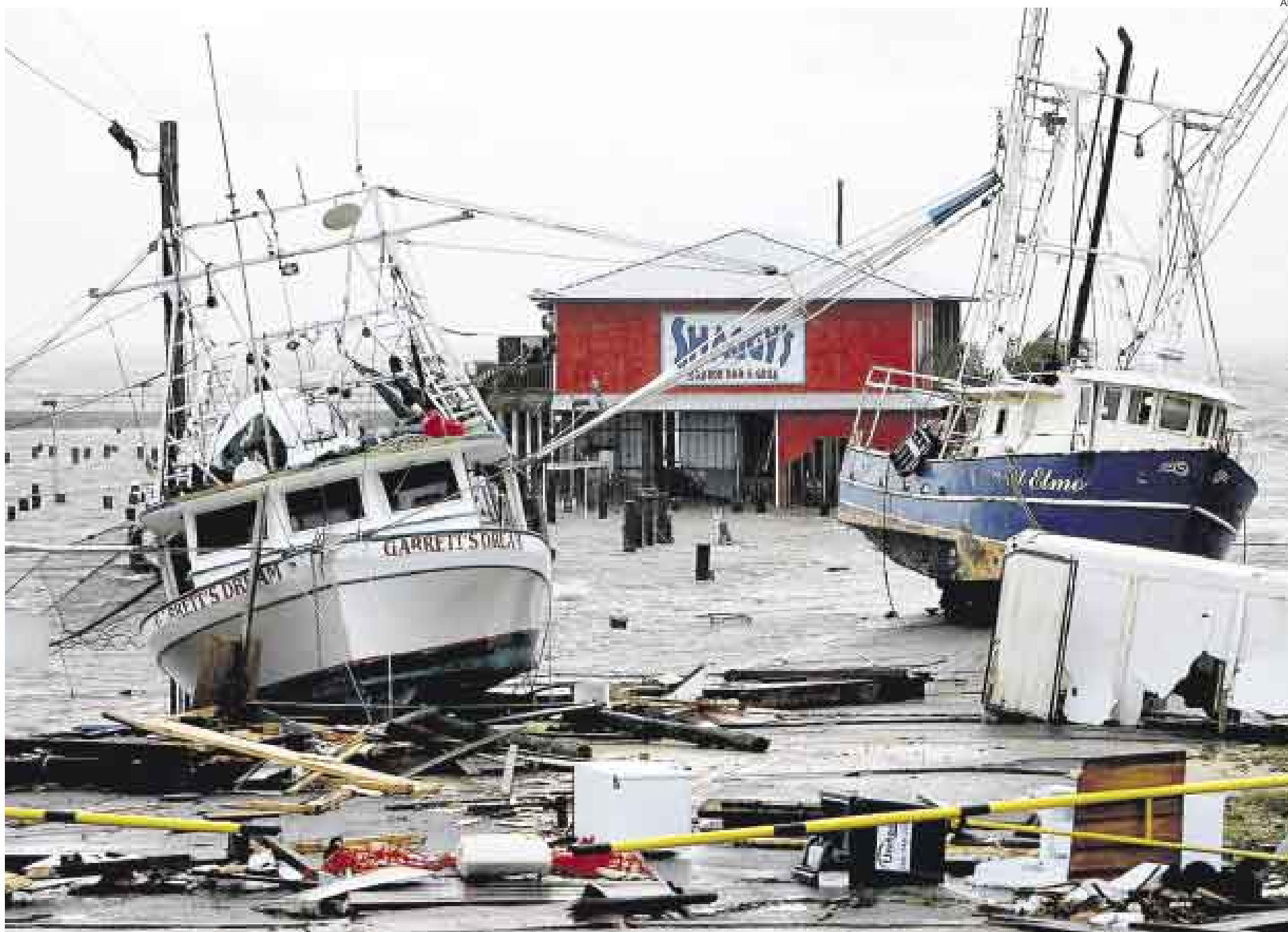
ARRASÓ. Muchas embarcaciones resultaron destruidas por la fuerza del viento ante el paso del huracán Gustav por Nueva Orleans. Los daños llegarían a los 10 mil millones de dólares.

En esa situación se encuentran dos barcos de la Armada estadounidense, cada uno de unos 100 metros de eslora, que se lo-