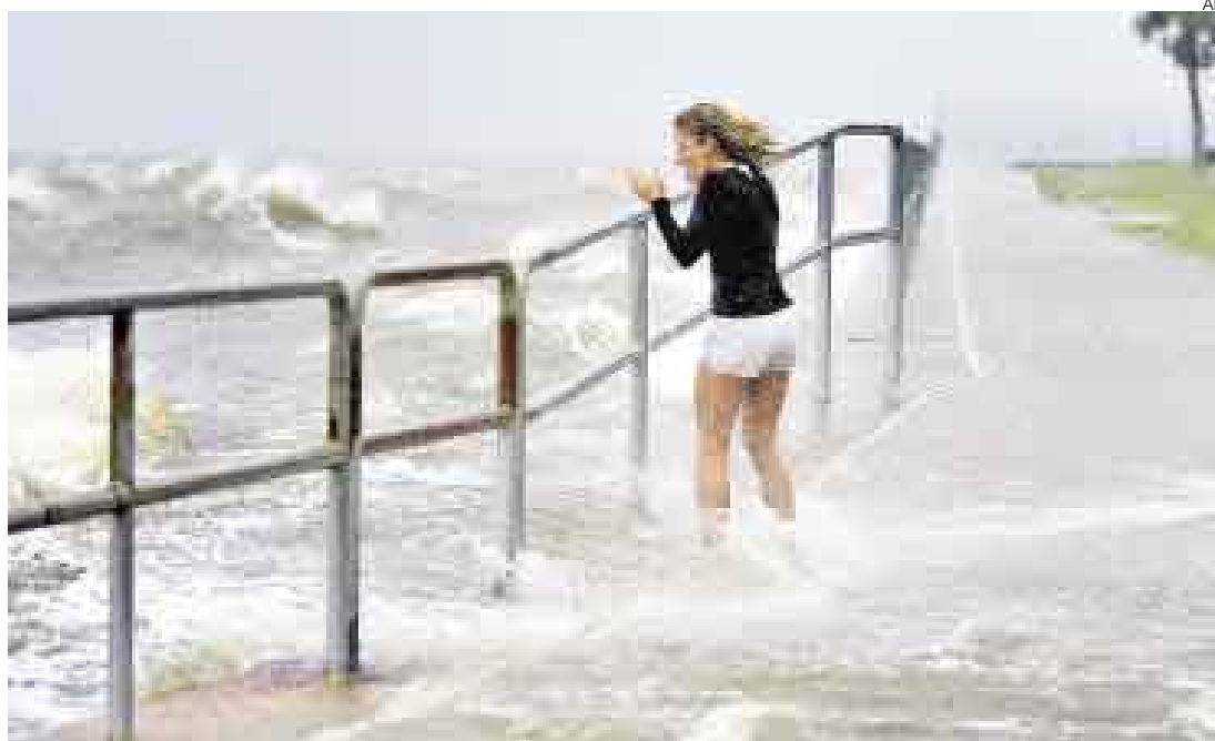
EMBATE DE LAS AGUAS. Como era de esperarse, el mar se encrespó durante todo el día de ayer.