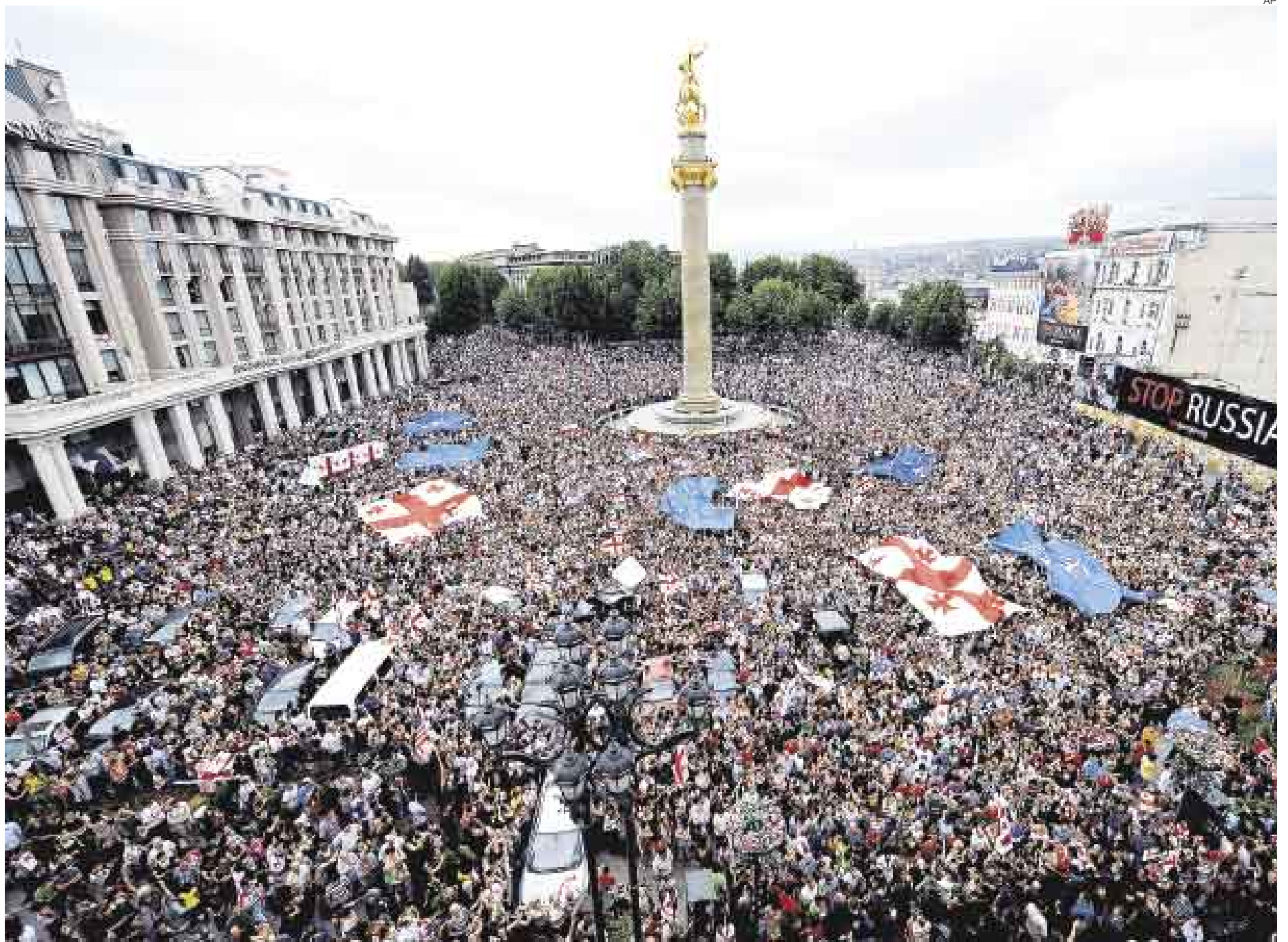
DENUNCIA. Mientras la Unión Europea se reunía, más de un millón de personas participaron en una cadena humana que recorrió todo el país para protestar por la agresión rusa.

La condena de la conducta de Rusia en el reciente conflicto va acompañada en las conclusiones del Consejo Europeo de un claro mensaje de apoyo político y económico a Georgia, y de un guiño a Ucrania, otra república