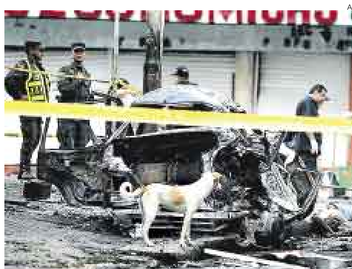
VÍCTIMA. El atentado tuvo lugar en las inmediaciones del Palacio de Justicia de Cali, capital del departamento del Valle.

■ Una quinta persona, una mujer, murió en la madrugada, debido a un intercambio de disparos que tuvo lugar después del estallido del carro-bomba, cuando algunos delincuentes intentaron robar y saquear comercios.