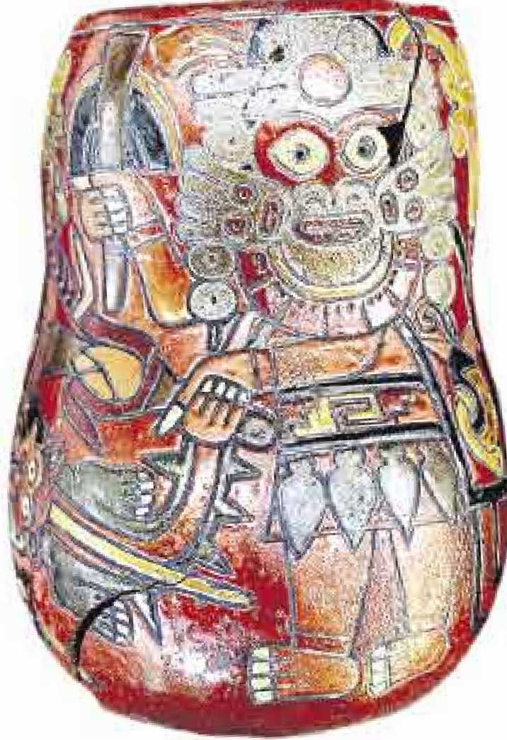
COMO NUEVOS. Para algunos de los mates se utilizó una especie de pintura resinosa, que fue la que les dio el brillo que hasta hoy ostentan.

“ Se estima que la ofrenda fue hecha entre los 350 y los 400 años después de Cristo ”