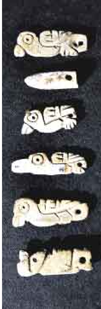
DEL MAR. Miniaturas hechas de conchas. Pertenecían a un collar.

“ Se estima que la ofrenda fue hecha entre los 350 y los 400 años después de Cristo ”