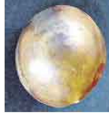
ÚNICO. De los objetos encontrados, este fue el único de oro.

El descubrimiento de la ofrenda y los últimos avances en los trabajos de puesta en valor del complejo fueron dados a conocer ayer en Lima por los dos expertos mencionados, quienes también informaron que ya se tienen conversa-