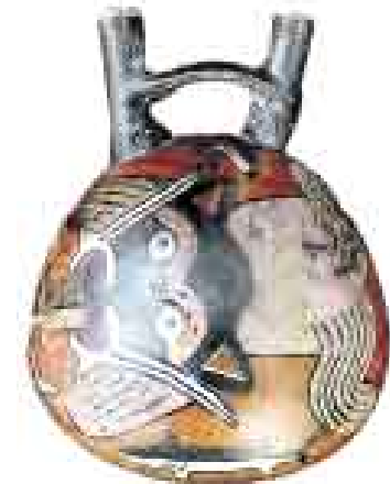
DELICADA LABOR. Algunos ceramios tuvieron que reconstruirse.