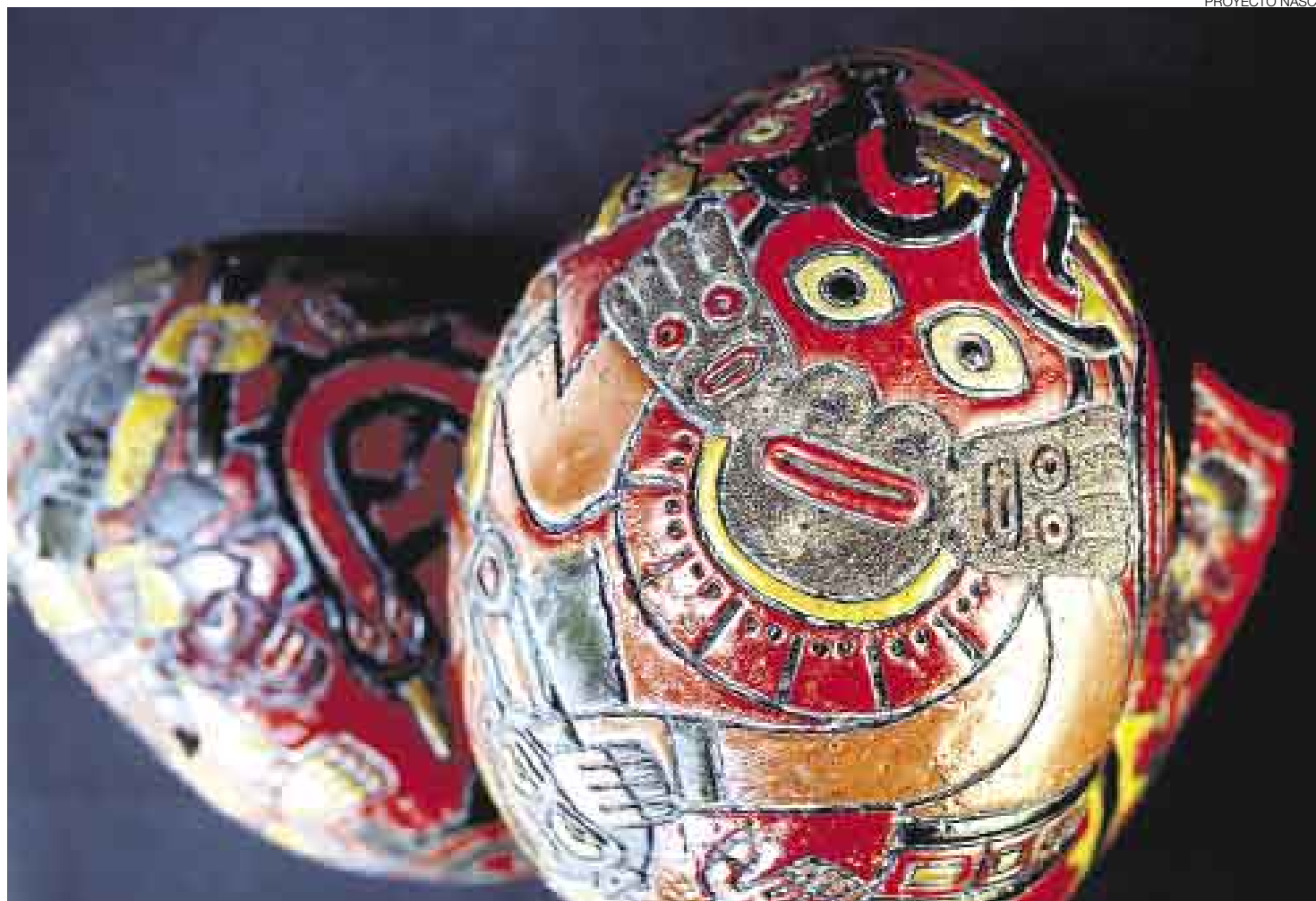
VENCEN AL TIEMPO. Los mates burilados parecen de reciente confección, pero datan del 400 d.C. Su riqueza pictórica se mantiene a través de los años.