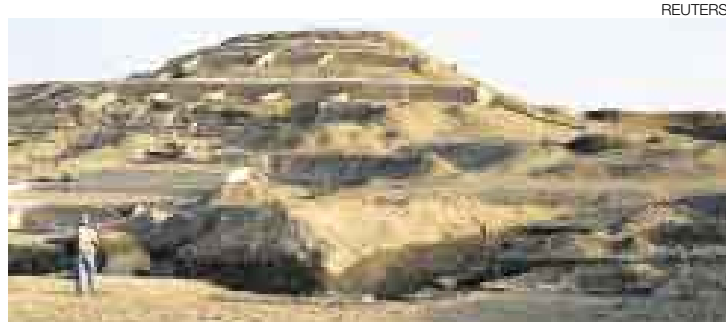
MAGNÍFICO. Cahuachi se ubica a 30 km al sureste de la ciudad de Nasca.

■ Arqueólogos del Proyecto Nasca hallaron en Cahuachi, el centro ceremonial de adobe más grande del mundo, treinta coloridos mates burilados conservados en perfecto estado, pese a sus 1.600 años de antigüedad. Las piezas, que fueron mostradas a El Comercio en exclusiva, presentan imágenes de felinos antropomorfos que ejecutan sacrificios.