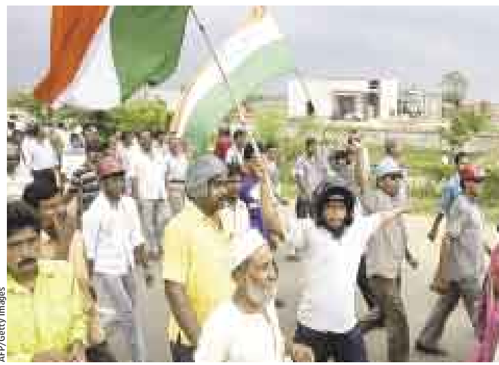
Una manifestación contra la construcción de la planta de Tata, la semana pasada.