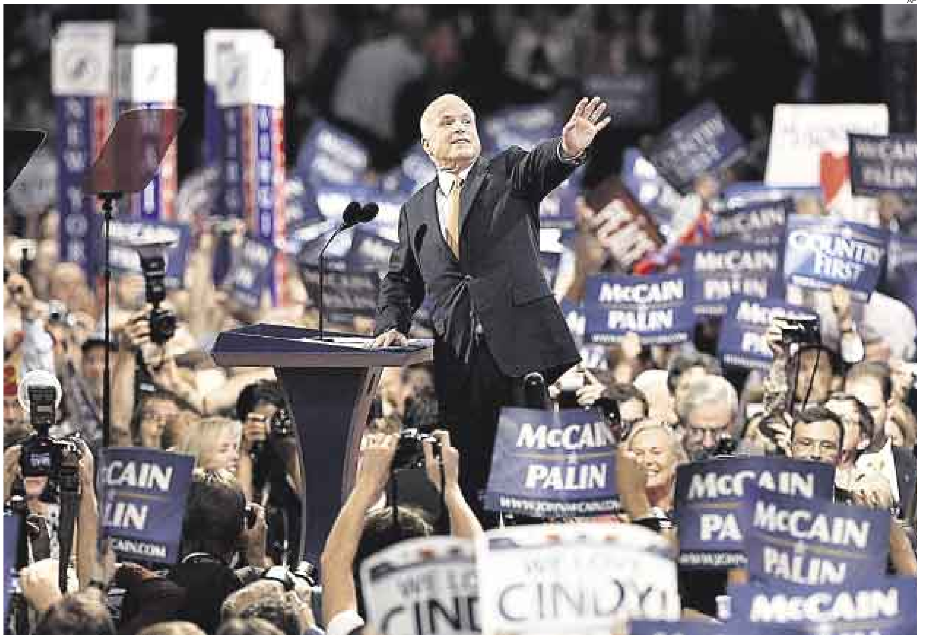
ACLAMADO. Unas 20 mil personas asistieron a la clausura de la convención republicana en St. Paul. Dijo que, si es elegido en noviembre, gobernará con todo aquel que quiera ayudarlo.

"Así es como gobernaré como presidente", agregó. "Extenderé mi mano a todo el que quiera ayudarme a sacar este país adelante. Tengo esos antecedentes y las cicatrices para probarlo. El senador Obama no los tiene".