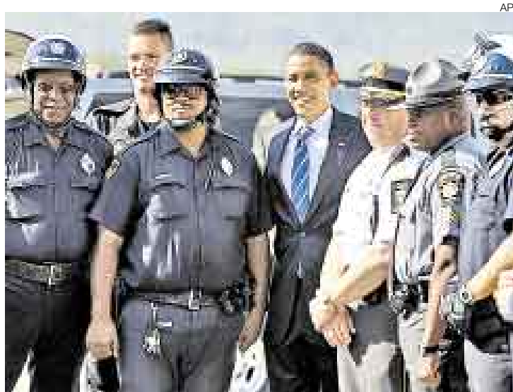
EN LA MIRA. Obama anunció que no dudará en investigar la gestión de Palin como gobernadora de Alaska y alcaldesa de un pequeño pueblo.

Palin dijo el miércoles que una gobernadora como ella tiene que tomar decisiones, a diferencia de lo que ocurre en una legislatura, donde sus miembros solo dicen presente. El comentario