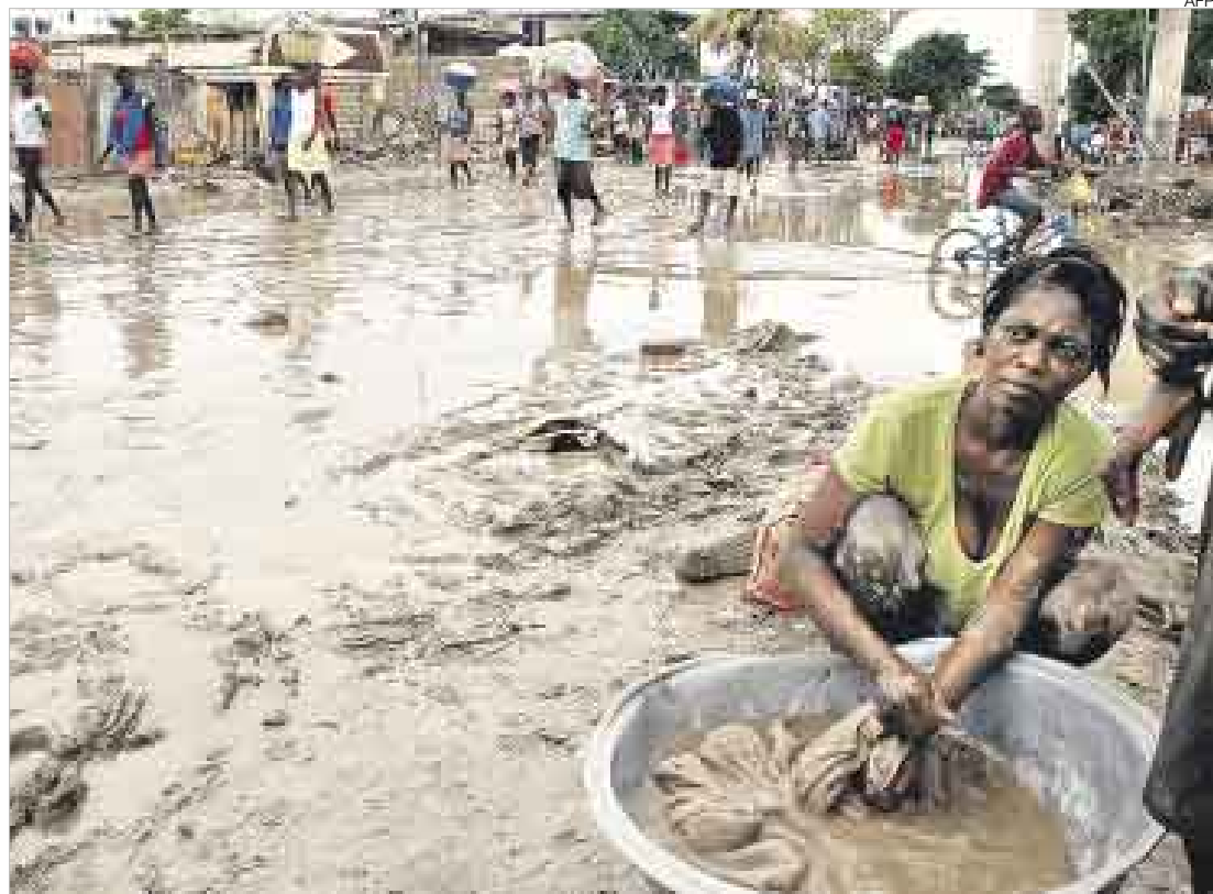
DESOLACIÓN. Las autoridades haitianas temen que la cifra de muertos aumente cuando descienda el nivel de las aguas. Existe incertidumbre y temor ante posible llegada de poderoso huracán Ike, que avanza con categoría 3.