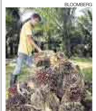
POTENCIAL. CULTIVO DE PALMA CRECE EN LA SELVA.

La empresa transnacional de Malasia, Sime Darby, que el año pasado facturó US$1.000 millones, está interesada en establecerse en nuestro país para desarrollar el negocio de la palma aceitera. Un grupo de representantes de SD que se encuentra en el país ha visitado Loreto, San Martín y Ucayali, en búsqueda de por lo menos 20.000 hectáreas de terrenos.