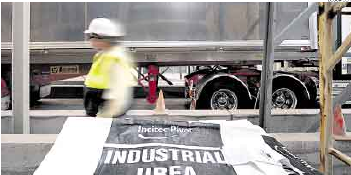
EN CRECIMIENTO. SI BIEN EL SECTOR ENFRENTA ALGUNOS PROBLEMAS ESTE AÑO, CONTINÚA CON BUENAS PERSPECTIVAS.