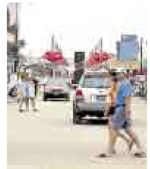
TEMPORADA 2009. YA TIENE FECHA: EL 5 DE DICIEMBRE.

Mientras tanto, 25 nuevos clientes se sumarían a la oferta del centro comercial, entre ellas las franquicias de la marca de calzados Crocs, de Gloria Jeans Coffee's, de la juguetería Alex Toys y de la marca de ropa para bebés Mimo and Company. Del mismo modo, están entrando los restaurantes Toshi-