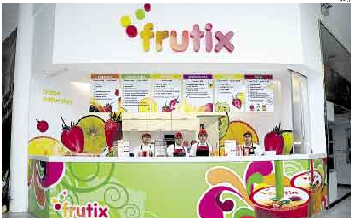
MÁS JUGOS. ESTE LOCAL SERÍA EL PRIMERO DE UNA SERIE DE QUIOSCOS EN LOS PRINCIPALES CENTROS COMERCIALES DEL PAÍS.