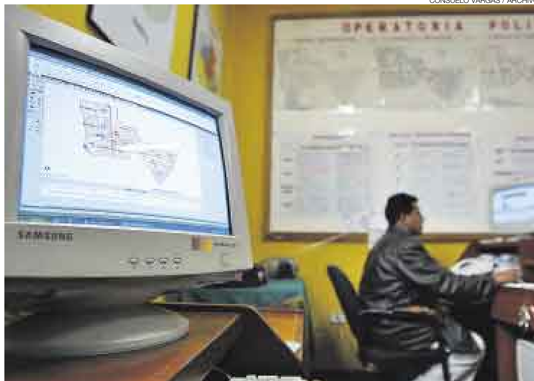
MODERNIZACIÓN. Las comisarías de Lima Metropolitana esperan que se concrete, para todas, la anunciada informatización necesaria para mejorar la lucha contra el crimen.

Rodrigo explicó que el modelo informático que debe aplicarse a las comisarías lo diseñaron expertos contratados por el consejo directivo del Sinacoop y de la propia Policía