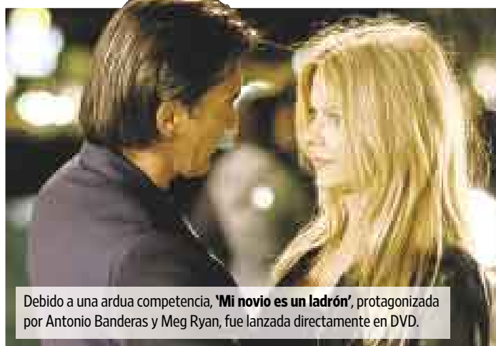
Debido a una ardua competencia, 'Mi novio es un ladrón' , protagonizada por Antonio Banderas y Meg Ryan, fue lanzada directamente en DVD.

El año pasado, más de 600 filmes (la mayoría independientes) fueron lanzados en los cines de EE.UU., frente a 466 en 2002, según la Asociación Cinematográfica de EE.UU. (MPAA, por su sigla en inglés). Eso es un promedio de 2,6 películas adicionales que luchan cada fin de semana por la atención del público. Buena parte de estas cintas también compete