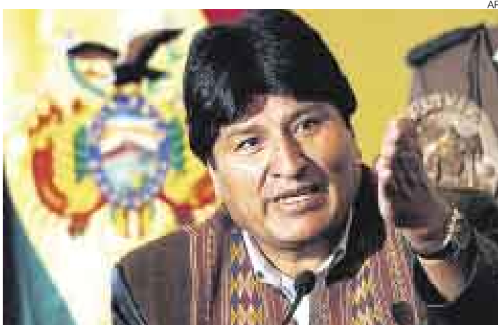
EVO ASEDIADO. En medio de crecientes protestas opositoras, Evo Morales renovó a su equipo ministerial para, dijo, erradicar la extrema pobreza.