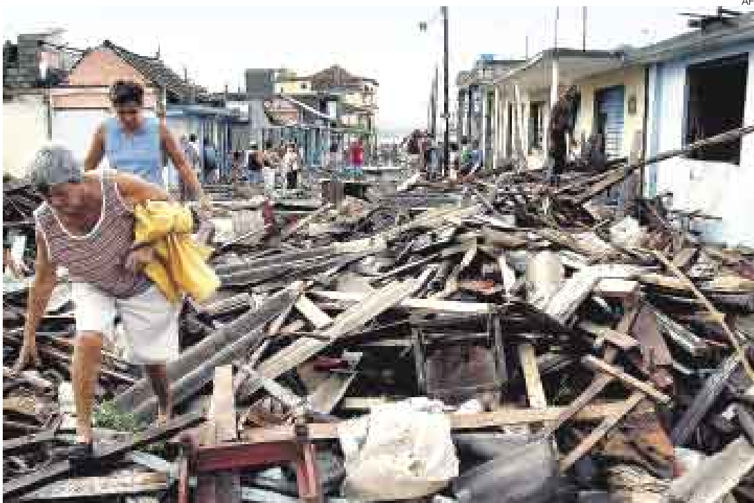
GOLPEÓ FUERTE. En Baracoa, Ike provocó olas de hasta 7 metros, que destruyeron numerosas viviendas

Por la noche, Ike se debilitó a categoría 1, con vientos de 130 kilómetros por hora, a medida que avanzaba a lo largo de la costa sur de Cuba, indicó el Centro Nacional