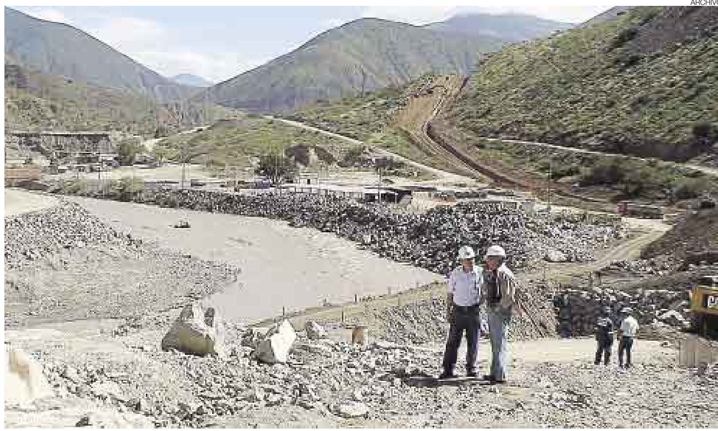
DOS PLANES. Mientras el Proyecto Olmos avanza en Lambayeque, en Piura los campesinos del Alto Piura saldrán a las calles a reclamar.