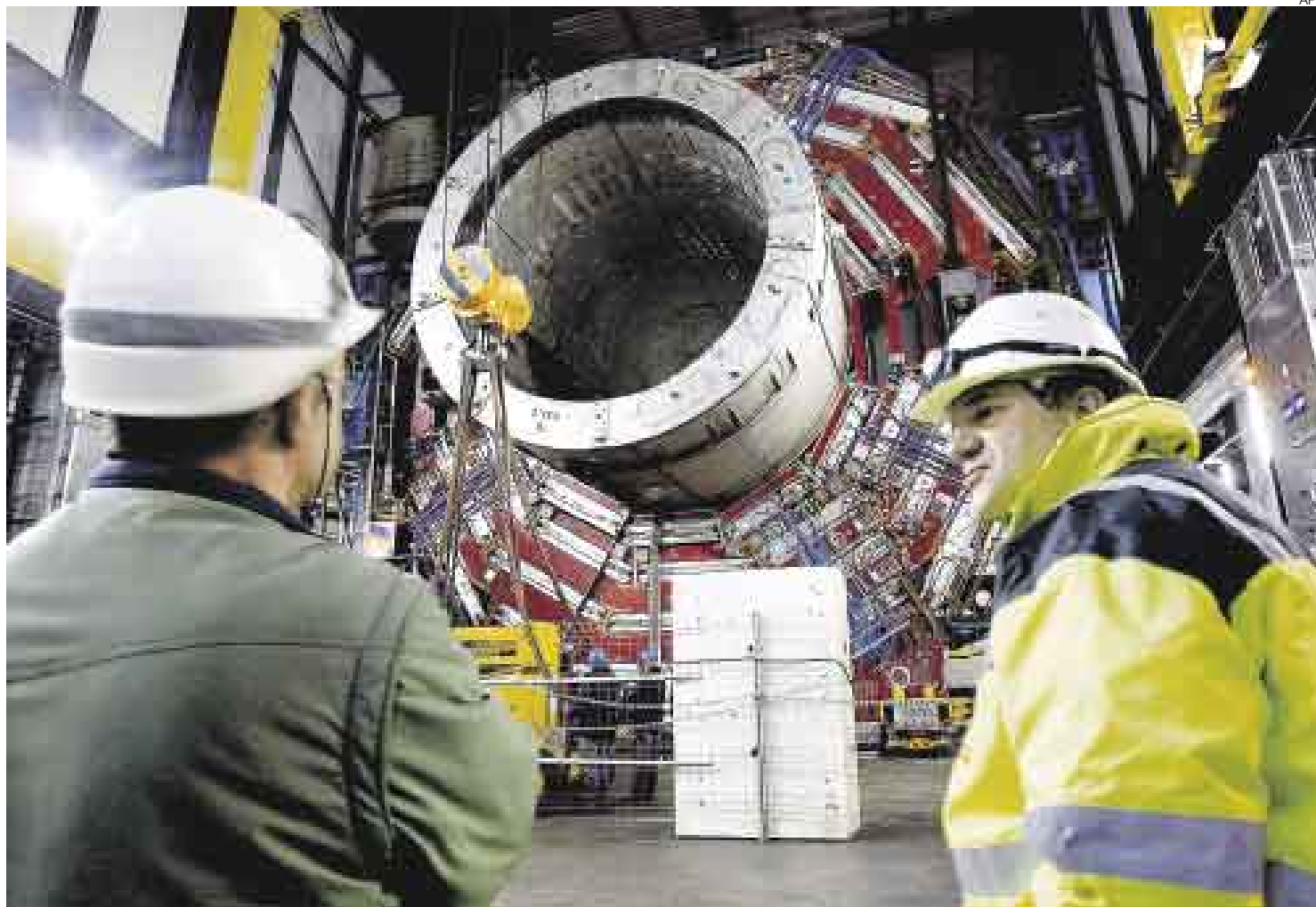
EN EL INTERIOR DEL TÚNEL. Los asistentes a la puesta en marcha del LHC observan uno de los cuatro gigantes puntos de colisión.

Tras el éxito de estas primeras pruebas, la pregunta que flota en el aire es cuándo se producirán las primeras colisiones frontales de partículas a la velocidad próxima a la de la luz, es decir, cuándo se recrearán los instantes posterior-