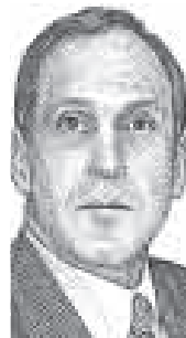
Richard S. Fuld Jr.

A medida que la acción de Lehman Brothers Holdings Inc. se desplomaba en las últimas semanas, su presidente ejecutivo Richard Fuld Jr. llamó a ejecutivos de otras firmas de Wall Street para cerciorarse de que aún estuvieran comerciando con su atribulada firma y ofreciéndole crédito. Los problemas seguían apareciendo, se quejó ante un ejecutivo, "me siento como si estuviera jugando a 'pegarle al topo' todos los días", dijo Fuld, según una fuente al tanto.