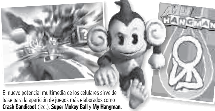
El nuevo potencial multimedia de los celulares sirve de base para la aparición de juegos más elaborados como Crash Bandicoot (izq.), Super Monkey Ball y My Hangman .

"Quedé muy sorprendido", dice Wakida. En particular le gustan las funciones del juego, que le permiten cambiar la velocidad del auto y la dirección con sólo inclinar el celular. La pantalla sensible al tacto también per-