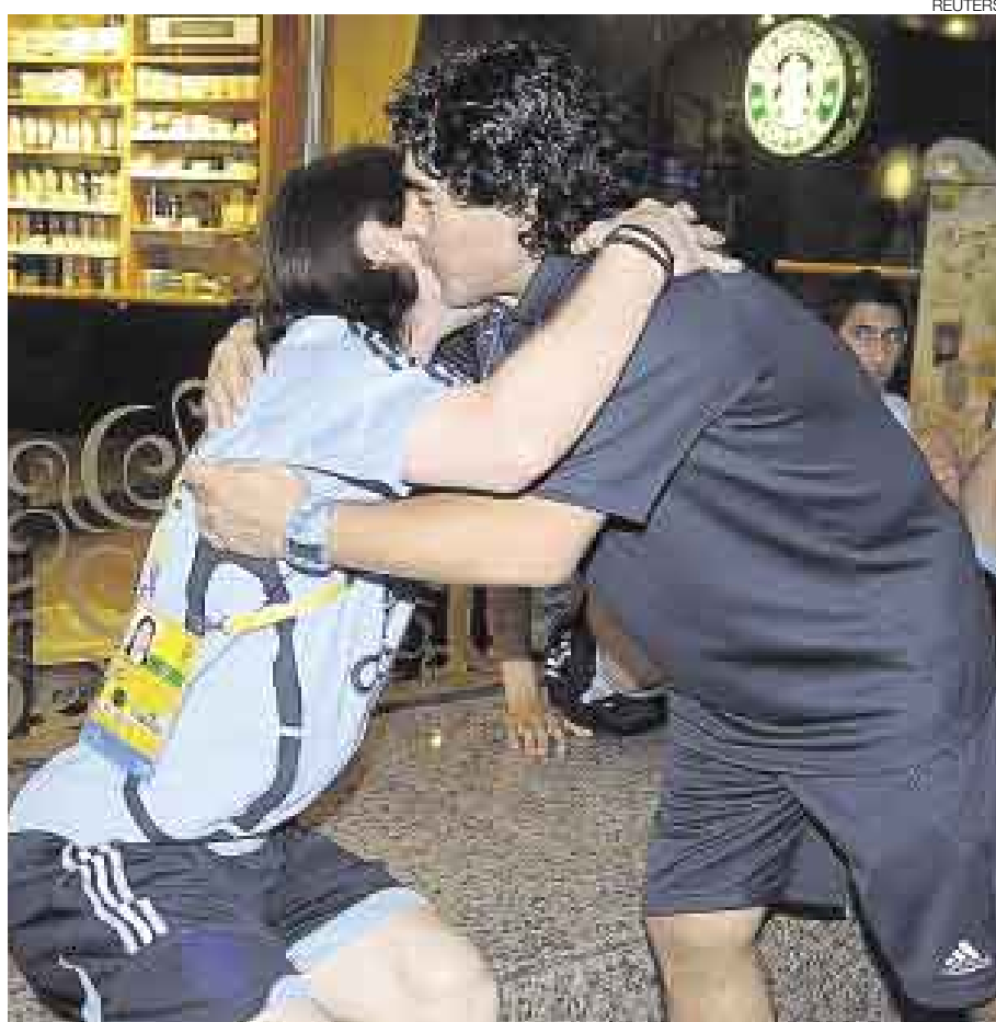
MUCHO LÍO. Según Diego, Messi trabaja para 'Deportivo Messi', no en equipo.

Diego Armando Maradona, en declaraciones a "Fox Sports", atacó a la