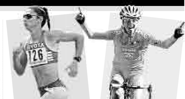
Ana Guevara Medalla de plata Atenas 2004