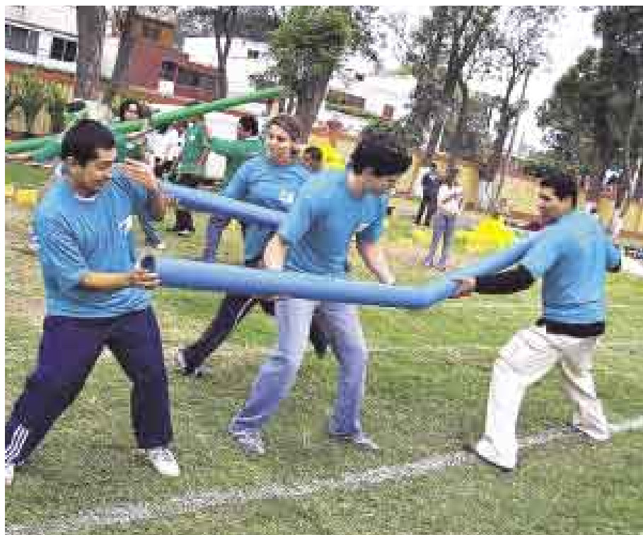
SE DAN ABASTO. Mundo Creativo tiene capacidad para realizar hasta cinco eventos al día.

¿Qué servicios tiene Mundo Creativo Empresarial? Muchas veces las empresas organizan gimkanas para sus trabajadores,