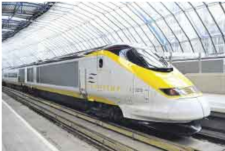
MUCHAS RUTAS. Las rebajas se venderán en todo el mundo a partir del 1 de octubre.

El Eurail Select Pass, por un lado, permite a los viajeros escoger tres o más países adyacentes a los cuales viajar, lo que permite un pase ferroviario prácticamente hecho a la medida. Y para