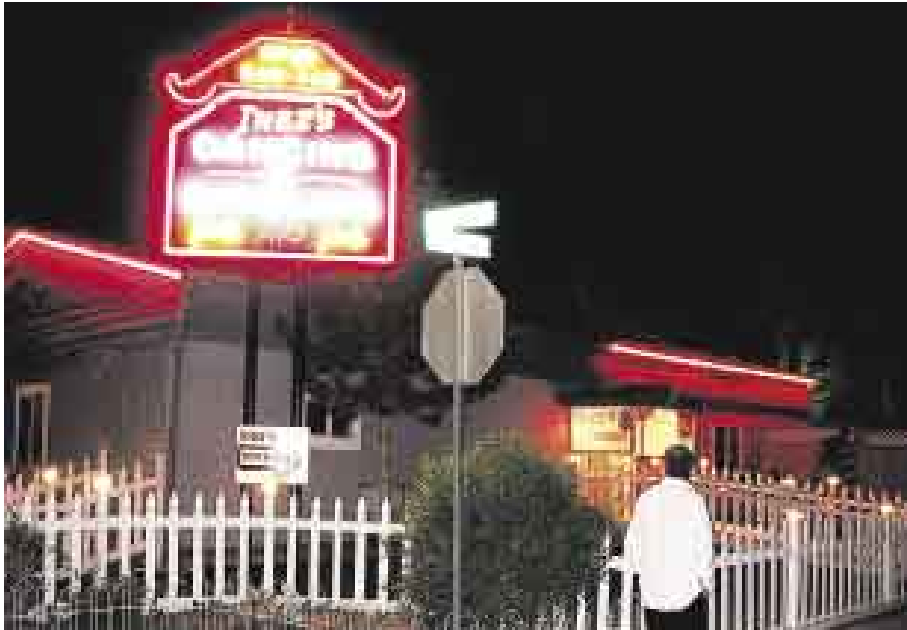
DIVERSION ADULTA. En los pequeños pueblos, los cabarets a discreción son muy buscados.