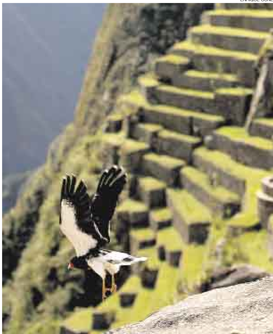
MÁS TURISTAS. Tomando las debidas precauciones se puede realizar un mejor viaje.

Por otro lado, como parte del lanzamiento de dicha campaña, la embajadora Nettleton, dejó conocer que para este año se esperaba alrededor de 78 mil turistas británicos, lo cual significaría una cifra 11% mayor en comparación con la del año pasado. "Los británicos se sienten muy interesados por conocer