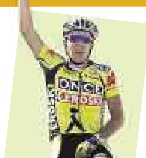
Carlos Sartre Ciclista

El programa conjunto de la ONU sobre el sida premió hoy al pivot de la NBA Yao Ming por su contribución en la prevención del sida y la lucha contra la discriminación de los afectados por el virus.