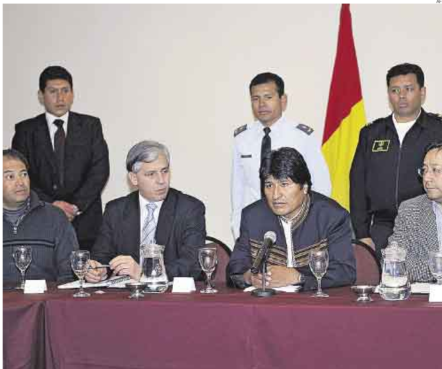
CONVERSACIÓN CLAVE . Las negociaciones se desarrollan bajo la atenta vigilancia de sectores sociales que apoyan al presidente Evo Morales.

Más temprano, el poderoso prefecto de Santa Cruz, Rubén Costas, principal adversario político