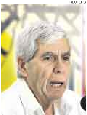
REFERENTE. El último filme del director fue “Barrio Cuba”.

LA HABANA [EFE]. La muerte del director cubano Humberto Solás, figura importante de la cinematografía latinoamericana y ganador del Premio Nacional de Cine de su país, ha causado conmoción en la isla, donde ha sido calificado por la prensa como un gran maestro del celuloide.