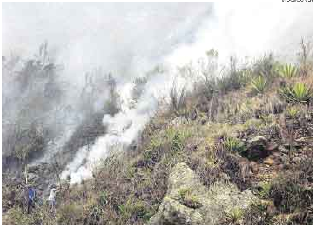
PRECARIEDAD. La geografía accidentada dificulta apagar el fuego. Brigadistas trabajan como pueden.