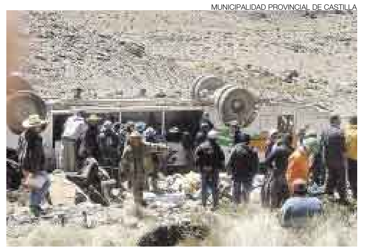
LAMENTABLE. La pérdida del control del ómnibus que viajaba a Orcopampa ocasionó la caída del vehículo a un barranco.